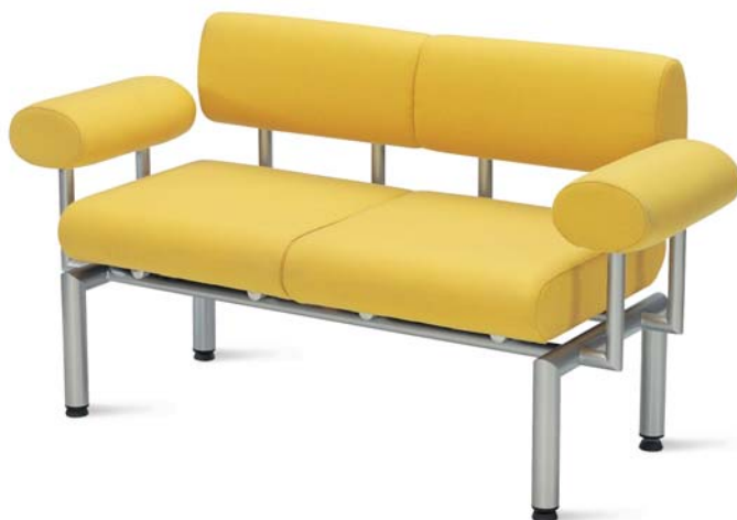
Linea LN S2P + LN LE + LN AR + LN AL

Przy zamawianiu elementów Linea prosimy o załączenie rysunków przedstawiających złożony system. When ordering elements from the Linea range please attach drawings showing the assembled system. Bei der Bestellung von Linea-Elementen erbitten wir den Anhang von das System umfassend darstellenden Zeichnungen.