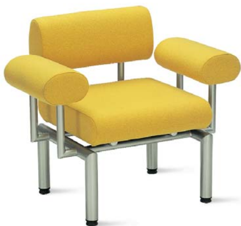
Linea LN S1P + LN LE + LN AR + LN AL