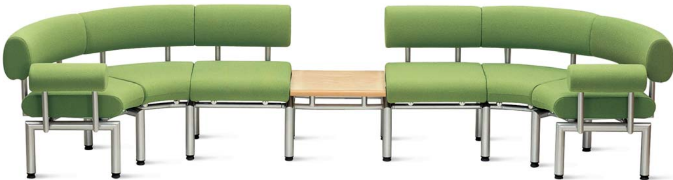
Linea LN S1P x 2 + LN 45ZP x 4 + LN TS + LN LE + LN AR + LN AL