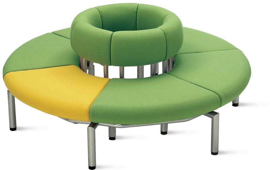
Linea LN 60WP x 6