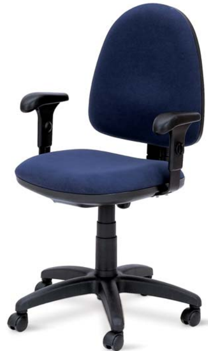
Flite FL 102 01 P60