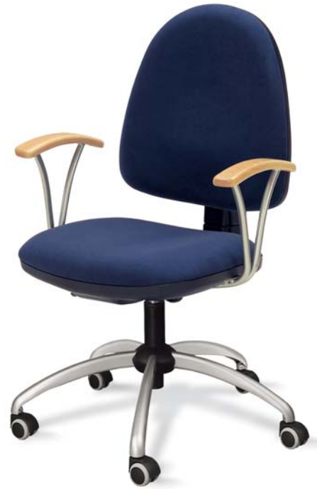
Flite FL 102 03 P70