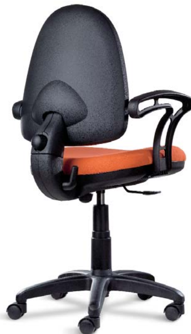
Flite FL 102 01 P40