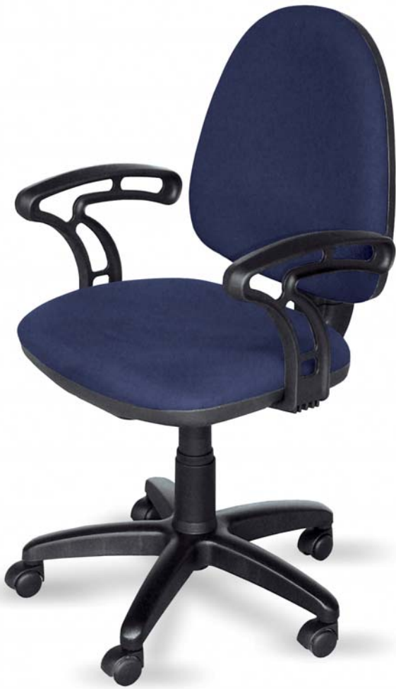
Flite FL 102 01 P40