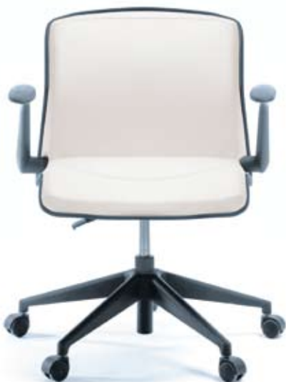
LINUS 20 E czarny PU