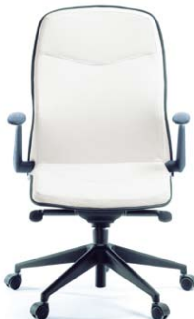
LINUS 10 Z czarny PU