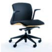
LINUS 20 Z czarny PU